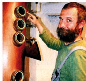
Und es kommt noch mehr: Hier sam-melt sich der destillierte Alkohol.