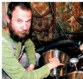
Geschmackstest bei den ersten Tropfen Hagebuttenbrand aus dem Hahn.

Ein Brand wird durch das Destillieren einer Getreide- oder Obstmaische erzeugt. Dabei wird der in der Maische durch Gärung erzeugte Alkohol gewonnen, der die Aromen des verarbeiteten Obsts oder Getreides trägt. Ein Likör wird zusätzlich mit Zucker, in der Regel Invertzuckersirup, versetzt. Der in einem Geist enthaltene Alkohol entsteht nicht durch Gärung, sondern wird den pürierten Früchten in Form von Neutralalkohol zugesetzt und nimmt so deren Aromen auf. (kb)